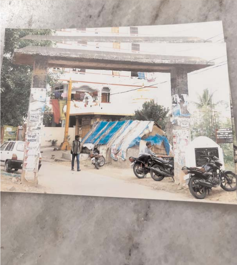
శేరిలింగంపల్లి అక్షిత ప్రతినిధి..

హఫీస్ పెట్ డివిజన్ పరిధిలోని మదినగూడ నడిబొడ్డున అమ్మవారి గుడి పక్కన గతంలో ఇది ప్రభుత్వ భూమి అని రెవెన్యూ అధికారులు బోర్డు కూడా పెట్టినారు ఇట్టి ప్రభుత్వ భూమిని కొందరు ప్రైవేటు వ్యక్తులు భవనములు నిర్మించి అమ్ముడానికి నిర్మాణం చేపట్టారు, గతంలో ఇట్టి భూమి ప్రభుత్వ భూమి అని ఎలా ఉంది ఇప్పుడు