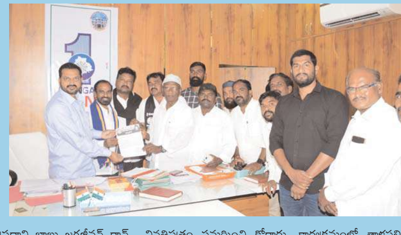
ప్రధాని బాబు జగజీవన్ రావ్

ఏప్రిల్ నెలలో మహనీయుల జయంతి ఉత్సవాలు నిర్వహించాలని దళిత సంఘాల నాయకులు ప్రజలకు పిలుపునిచ్చారు. శుక్రవారం స్థానిక మహాత్మ జ్యోతిరావు పూలే బిసె భవన్ లో జరిగిన ఐక్య దళిత సంఘాల సమావేశంలో వారు మాట్లాడుతూ ఏప్రిల్ 5న మాజీ ఉప