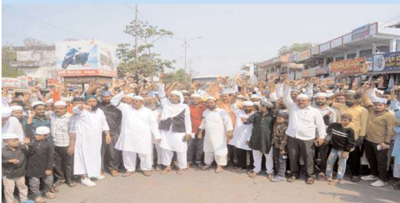
కోదాడ అక్షయ ప్రతినిధి