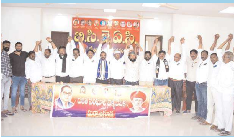
మిర్యాలగూడ, ఆక్షిత ప్రతినిధి :

ఏప్రిల్ నెలలో మహనీయుల జయంతి ఉత్సవాలు నిర్వహించాలని దళిత సంఘాల నాయకులు ప్రజలకు పిలుపునిచ్చారు. శుక్రవారం స్థానిక మహాత్మ జ్యోతిరావు పూలే బిసె భవన్ లో జరిగిన ఐక్య దళిత సంఘాల సమావేశంలో వారు మాట్లాడుతూ ఏప్రిల్ 5న మాజీ ఉప