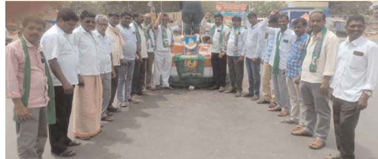
రామన్నపేట అక్షిత ప్రతినిధి