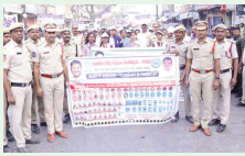
పరంగల్, అక్షిత బ్యారో:

శనివారం జాతీయ రోడ్డు భద్రత మాసోత్సవం ? 2026