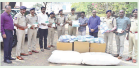
పరంగల్, అక్షిత బ్యారో: వచ్చే వారంలో ప్రారంభం కానున్న మేడారం సమ్మక్క సారలమ్మ జాతర