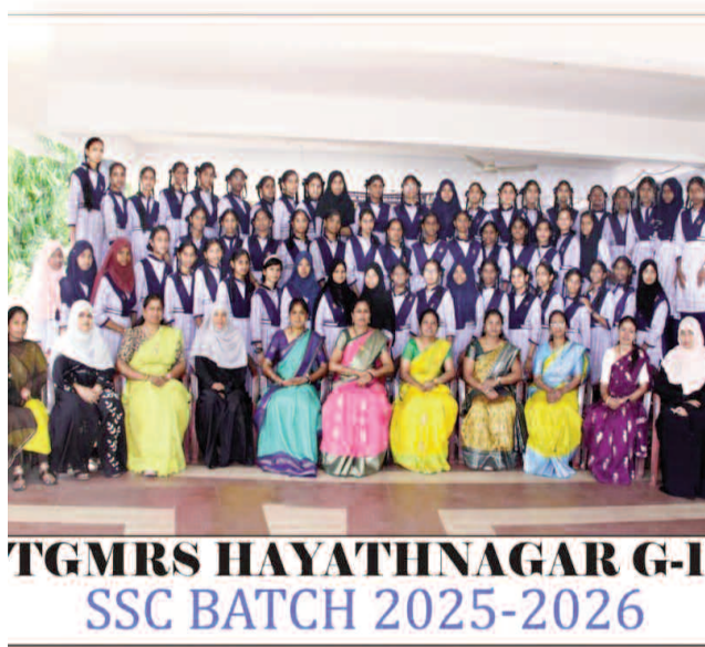
TGMRS HAYATHNAGAR G-I SSC BATCH 2025-2026

మైనాలటీ రెసిడెన్షియల్ విద్యార్థినుల ప్రతిభ