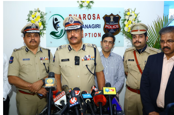
ప్రారంభించారు. ఈ కార్యక్రమంలో జిల్లా పోలీస్ ఉన్నతాధికారులు మరియు ఇతర సిబ్బంది పాల్గొన్నారు.