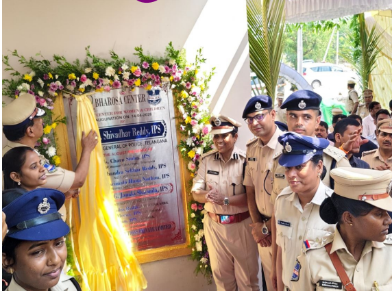
అధికారులు, సిబ్బంది, షి డీపీ, భరోసా సిబ్బంది ఉన్నారు.