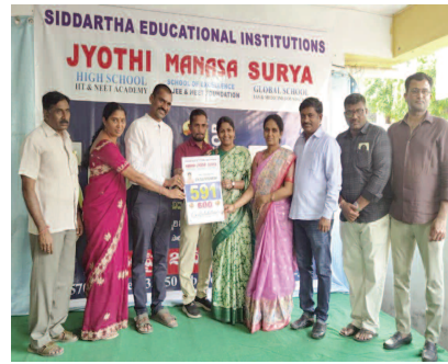
గుర్తింపును తీసుకొచ్చారు. అదే విధంగా అత్యుత్తమ

జగిత్యాల అక్షితబ్యూరో: జగిత్యాల పట్టణంలోని సిద్ధార్థ విద్యాసంస్థలు మరోసారి తమ ప్రతిభను చాటుకుంటూ పదవ తరగతి ఫలితాలలో రాష్ట్ర స్థాయిలో అద్భుత విజయాన్ని సాధించాయి. 2026 ఏప్రిల్ 29 బుధవారం రోజున విడుదలైన పదవ తరగతి పరీక్షా ఫలితాలలో రాష్ట్ర స్థాయిలో 591, 590 మార్కులతో జిల్లా స్థాయిలో మొదటి స్థానంలో నిలిచారు. అదే విధంగా 591,590 తో పాటు 580 పైన 21 మంది విద్యార్థులు, 570 పైన 63 విద్యార్థులు, 550 పైన 149 విద్యార్థులు, 500 పైన 324 విద్యార్థులు అత్యుత్తమ మార్కులు సాధించి సంస్థకు ప్రత్యేక