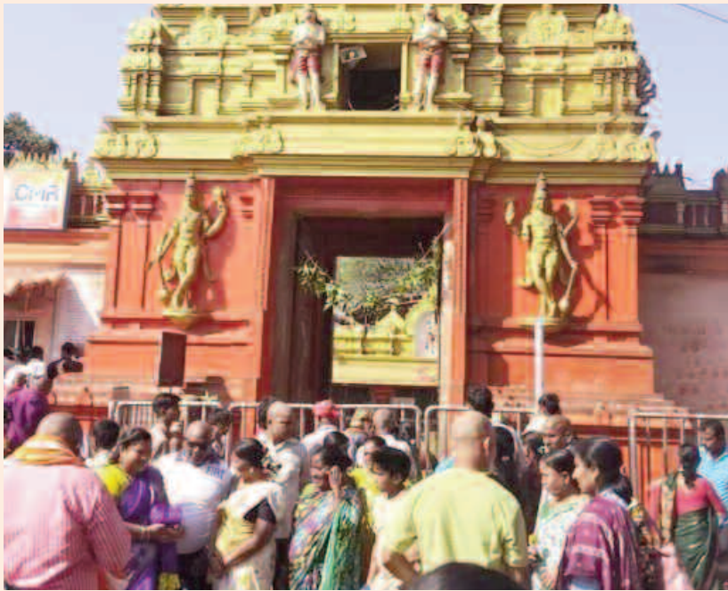
ఉన్న అందమైన పరిసరాల తో కూడా పర్యాటకులను ఆకర్షిస్తుంది. హనుమాన్ స్వామికి అంకితమైన ఈ క్షేత్రం భక్తి, విశ్వాసాలకు ప్రతీకగా నిలుస్తోంది. స్థానిక ప్రజలు, భక్తులు ఈ గుర్తింపును

జగిత్యాల అక్షితబ్యూరో: తెలంగాణలోని అత్యంత శక్తివంతమైన పుణ్యక్షేత్రం గా పేరు ఉన్న జగిత్యాల జిల్లా లోని ప్రసిద్ధి చెందిన కొండగట్టు అంజన్న ఆలయానికి అరుదైన గౌరవం దక్కింది. దేశవ్యాప్తంగా ఉన్న ప్రముఖ పర్యాటక ప్రాంతాల విశేషాలను పరిచయం చేస్తూ -నీతిఅయోగ్-రూపొందించిన 'దివ్య భారత్' పుస్తకంలో ఈ క్షేత్రానికి ప్రత్యేక స్థానం లభించడం విశేషం. దేశంలోని పలు రాష్ట్రాల ఆధ్యాత్మిక, సాంస్కృతిక, పర్యాటక ప్రాధాన్యం కలిగిన ప్రాంతాలను ఒకే చోట సమగ్రంగా పరిచయం చేయాలనే ఉద్దేశ్యంతో ఈ పుస్తకాన్ని రూపొందించారు.