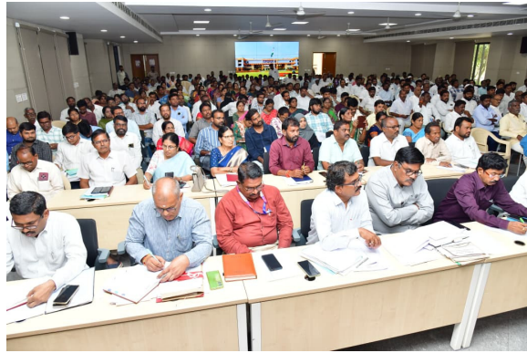
మరికొన్ని మండల మరియు జిల్లా స్థాయిలో పరిష్కరించాల్సి ఉంటుందని వివరించారు.

ప్రతి గ్రామాన్ని సందర్శించడం సాధ్యం కాకపోయినా, ఇలాంటి సమావేశాల ద్వారా సమస్యలను తెలుసుకోవడం సులభమవుతుందని పేర్కొన్నారు. కొన్ని సమస్యలు గ్రామ స్థాయిలోనే పరిష్కరించవచ్చని,