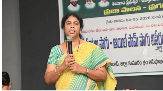
కలవారు జూన్ 30 లోపు తమ ఎంట్రీలను google drive ద్వారా hhrshortfilm@gmail.comకి పంపించాలని కలెక్టర్ తెలిపారు.