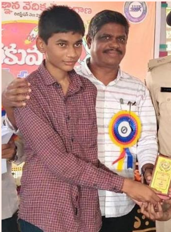
విద్యార్థి అధిన చేయడంతో పాటు ప్రతి విద్యార్థి పై ప్రత్యేక శ్రద్ధ చూపడం జరుగుతుందన్నారు.

వారు చదువులో రాణించేందుకు ప్రణాళికా బద్ధంగా