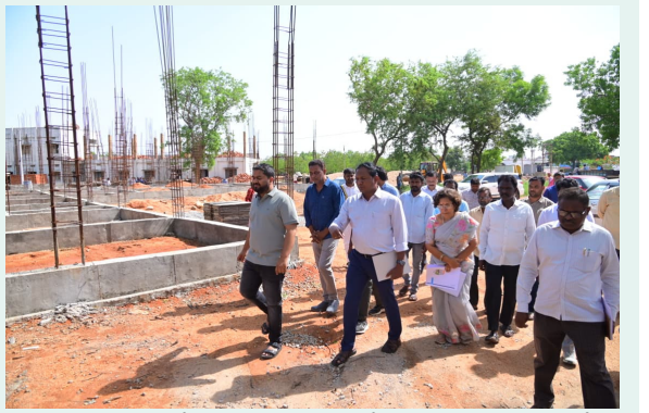
విద్యను అభ్యసించే అవకాశం కల్పించేందుకు ప్రభుత్వం భారీగా నిధులు వెచ్చిస్తోందన్నారు.

ఈ సందర్భంగా జిల్లా కలెక్టర్ మాట్లాడుతూ.... రాష్ట్ర ప్రభుత్వం విద్యారంగ అభివృద్ధికి అత్యంత ప్రాధాన్యత ఇస్తోందన్నారు. ప్రభుత్వ పాఠశాలల్లో చదివే విద్యార్థులకు ప్రైవేటు విద్యాసంస్థలకు డీటుగా అన్ని వసతులు కల్పించాలనే లక్ష్యంతో తెలంగాణ పబ్లిక్ స్కూల్స్ ను అంతర్జాతీయ స్థాయి ప్రమాణాలతో అభివృద్ధి చేస్తున్నట్లు, గ్రామీణ ప్రాంతాల విద్యార్థులు కూడా అత్యాధునిక విద్యా వాతావరణంలో