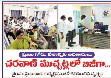
ప్రజల గోడు బనాల్సిన అధికారులు చరవాణి ముచ్చట్లలో జరిగా... ఖైంసా ప్రజావాణి కార్యక్రమంలో కనపించిన దృశ్యం