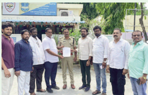
కోదాడ అక్షిత ప్రతినిధి: తెలంగాణ రాష్ట్ర మంత్రివర్గులు ఉత్తమ్ కుమార్ రెడ్డి, ఎమ్మెల్యే ఉత్తమ్ పద్మావతి రెడ్డిలపై