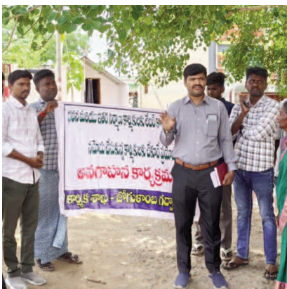
సంక్షేమ పథకాలు అందుబాటులో ఉంటాయని చెప్పారు. కార్మికులు ఆధార్ కార్డు, బ్యాంకు పాస్ బుక్, మొబైల్ నంబర్, ఫోటోలు, ఉపాధి ధ్రువీకరణ పత్రంతో సమీప మీ సేవ కేంద్రంలో రూ.110 సేవ రుసుము చెల్లించి రసీదు తీసుకుని, కలెక్టరేట్ గది నెం.23 లోని జిల్లా లేబర్ కార్యాలయంలో నమోదు