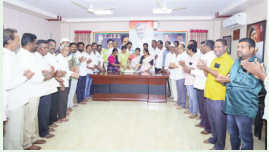
సత్తుపల్లి, అక్షిత స్టూస్: లోక్ సభ ప్రతిపక్ష నాయకులు, కాంగ్రెస్ పార్టీ అగ్రనేత రాహుల్ గాంధీ జన్మదిన

ఎమ్మెల్యే క్యాంపు కార్యాలయంలో కేక్ కట్ చేసి కాంగ్రెస్ పార్టీ శ్రేణులతో సంబరాలలో పాల్గొన్న ఎమ్మెల్యే మట్టా