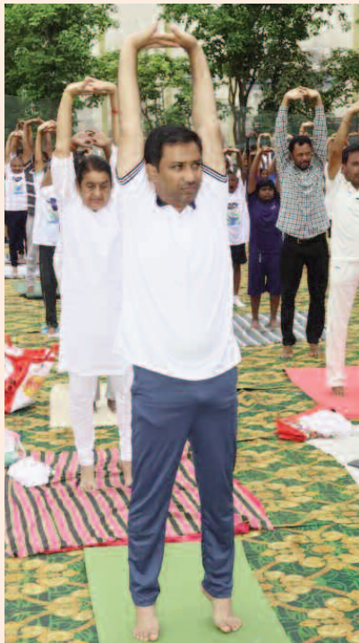
వారు పాల్గొనేవారని ఇక్కడ పౌర సమాజం నుండి