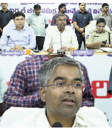
ప్రజల సమిష్టి భాగస్వామ్యం, అధికారుల కృషితోనే “ప్రజా పాలన - ప్రగతి ప్రణాళిక” విజయవంతం

ఈ సందర్భంగా ప్రత్యేక అధికారి మాట్లాడుతూ, అన్ని శాఖలు 99 రోజుల ప్రత్యేక కార్యక్రమాలు అన్ని శాఖల అధికారులు విజయవంతంగా నిర్వహించారని ప్రశంసించారు. భవిష్యత్తులోనూ ఇదే స్ఫూర్తిని కొనసాగిస్తూ శాఖల వారిగా సంబంధిత పథకాలు, సంక్షేమ ఫలాలు అన్ని అట్టడుగు వర్గాల ప్రజలకు చేరే విధంగా అధికారులు కృషి చేయాలన్నారు. స్పష్టమైన ప్రణాళికతో ప్రజా పాలన కార్యక్రమాన్ని విజయవంతం చేసేందుకు అధికారులకు శుభాకాంక్షలు తెలిపారు. అధికారులు వెల్లడించిన నివేదికలపై ఆయన సంతృప్తి వ్యక్తం చేశారు. పోలీసు శాఖ చేపట్టిన ప్రత్యేక కార్యక్రమాల పట్ల జిల్లాలో రోడ్డు ప్రమాదాలు తగ్గుముఖం పట్టాయన్నారు. ఇన్స్పీవేటివ్ ఆలోచనలతో అధికారులు ముందుకు సాగాలన్నారు.