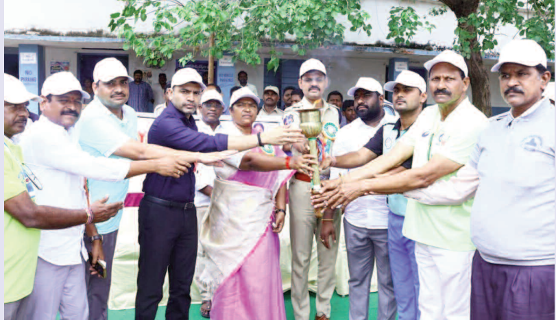
క్రీడాకారులు పతకాలు సాధించి జిల్లాకు కీర్తి తెచ్చారని గుర్తుచేశారు. క్రికెట్తో పాటు ఇతర క్రీడల్లోనూ విద్యార్థులు ముందుకు రావడం సంతోషకరమన్నారు.