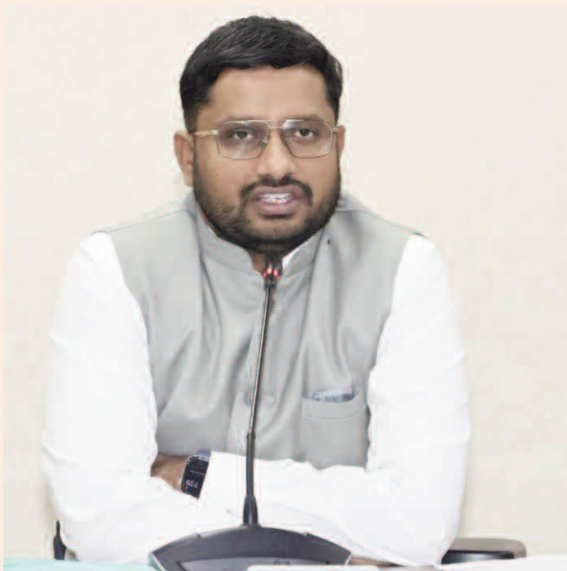
మరియు దరఖాస్తు విధానం కోసం మహిళా శిశు సంక్షేమ శాఖ అధికారిక వెబ్సైట్ అయినను సందర్శించాలని జిల్లా కలెక్టర్ సూచించారు.ఆన్లైన్ లో సమర్పించిన దరఖాస్తులు మాత్రమే