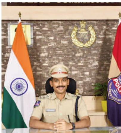
ఆర్డర్, ట్రాఫిక్ పోలీస్ స్టేషన్ల పరిధిలో విస్తృతంగా వాహన తనిఖీలు నిర్వహించినట్లు వెల్లడించారు.