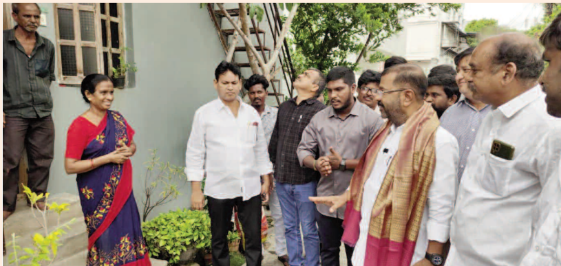
లక్ష్యమని స్పష్టం చేశారు.

అనంతరం ఎమ్మెల్యే మాట్లాడుతూ, గత ప్రభుత్వాల హయాంలో ఒక్కో డివిజన్ కు నామమాత్రంగా నిధులు కేటాయించేవారని, ప్రస్తుతం ఒక్కో డివిజన్ కు రూ.10 కోట్ల నుంచి రూ.20 కోట్ల వరకు అభివృద్ధి పనులు చేపడుతున్నామని తెలిపారు. వరంగల్ పశ్చిమ నియోజకవర్గంలో ప్రతి కాలనీకి మెరుగైన రోడ్లు, డ్రైనేజీలు, మౌలిక సదుపాయాలు కల్పించడమే తమ