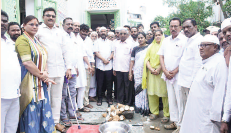
కేటాయించినట్లు ఎమ్మెల్యే వెల్లడించారు. కాజీపేట పోలీస్ స్టేషన్ నుంచి సోమిడి వరకు

గత మూడు సంవత్సరాల్లో నియోజకవర్గంలోని ప్రతి డివిజన్ కు సుమారు రూ.10 కోట్లకు పైగా అభివృద్ధి నిధులు